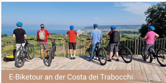
E-Biketour an der Costa dei Trabocchi